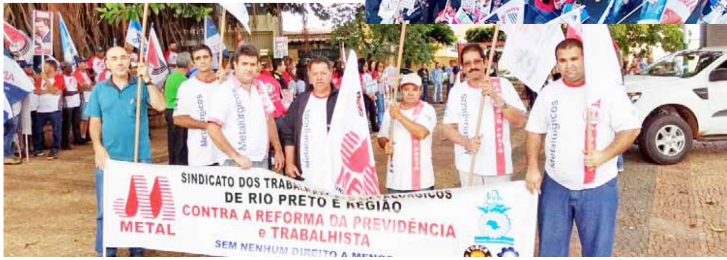
Grande manifestação realizada no dia 30 de junho, na cidade de São José do Rio Preto, contra a reforma previdenciária e trabalhista