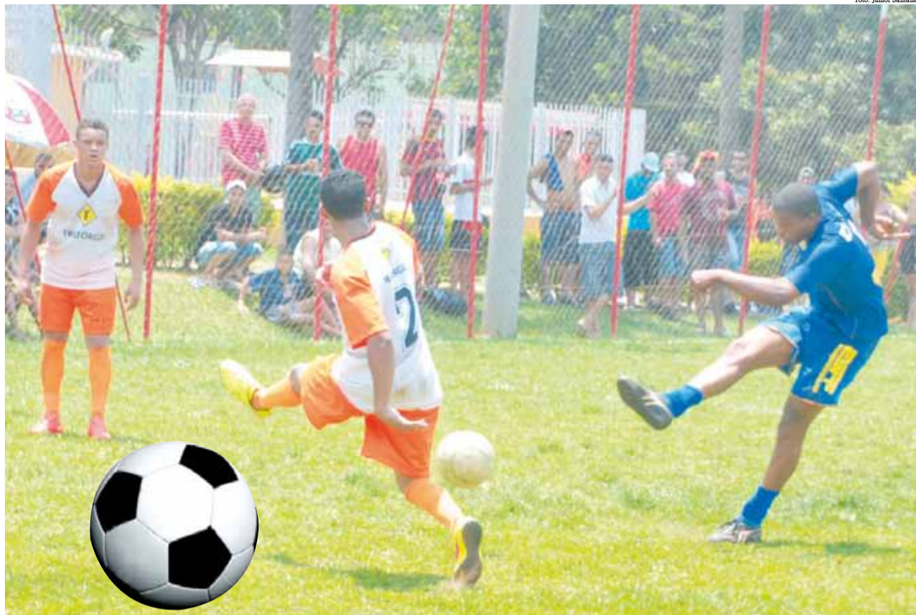
As equipes já estão se preparando para mais uma disputa acirrada, com times fortes que mais uma vez vão trazer lindos jogos