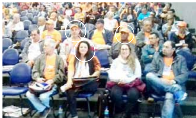
Diretores do Sindicato no 8º Congresso Nacional da Força Sindical

A diretoria do Sindicato dos Metalúrgicos de São José do Rio Preto participou do 8º Congresso Nacional da Força Sindical, realizado em Praia Grande/SP, entre 12 e 14 de junho de 2017, que foi encerrado com a aprovação unânime das resoluções que vão nortear as ações da central nos próximos quatro anos, com uma nova diretoria