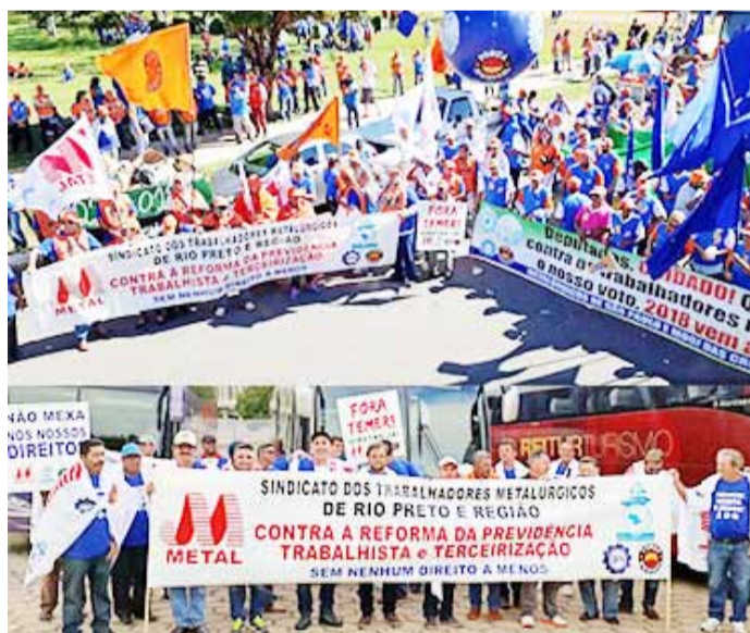
Manifestação realizada no dia 24 de maio, na cidade de Brasília