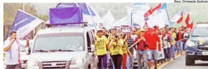
Manifestação realizada no dia 28 de abril, na BR 153 em São José do Rio Preto